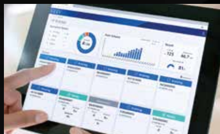
Epson felhőalapú PORT platform

A kiváló képminőséget három Epson nyomtatási technológia biztosítja – féltónus, optimalizált LUT és Micro Weave – csökkentve a szemcsézettséget és a csíkozást. A teljes körűen vezérelt fűtési és szárítási technológia, valamint a hosszú élettartamú PrecisionCore nyomtatófej megbízható színkonzisztenciát biztosít a teljes nyomtatási folyamat során. Ezzel elkerülhető az eltérő színek miatti újranyomtatás igénye.