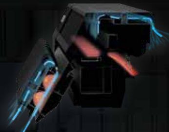
Σχεδιασμός θερμαντήρα κατά της σκόνης

Ο καινοτόμος ανιχνευτής υπερήχων μειώνει τον κίνδυνο βλάβης της κεφαλής εκτύπωσης, ενώ η τεχνολογία NVT (τεχνολογία επαλήθευσης ακροφυσίων) αντισταθμίζει αυτόματα σε περίπτωση που φράξει κάποιο ακροφύσιο. Οι κεφαλές εκτύπωσης με δυνατότητα αντικατάστασης από τον χρήστη συνεχίζουν να μεγιστοποιούν το χρόνο παραγωγής, καθώς μπορούν εύκολα να αντικατασταθούν, χωρίς ειδικά εργαλεία, εντός 60 λεπτών. Επιπλέον, το μοντέλο SC-R5010L περιλαμβάνει μια λύση χύδην μελανιού, που υποστηρίζεται από μια δυνατότητα αντικατάστασης εν ώρα λειτουργίας «hot-swap».