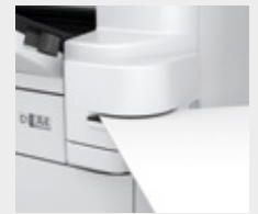
Zimba (sadece WF-C879R)