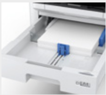
500 sayfalık kağıt kaseti