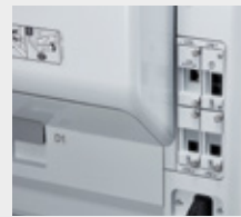
Ethernet/Faks bağlantı noktası seçenekleri (sadece WF-C879R)