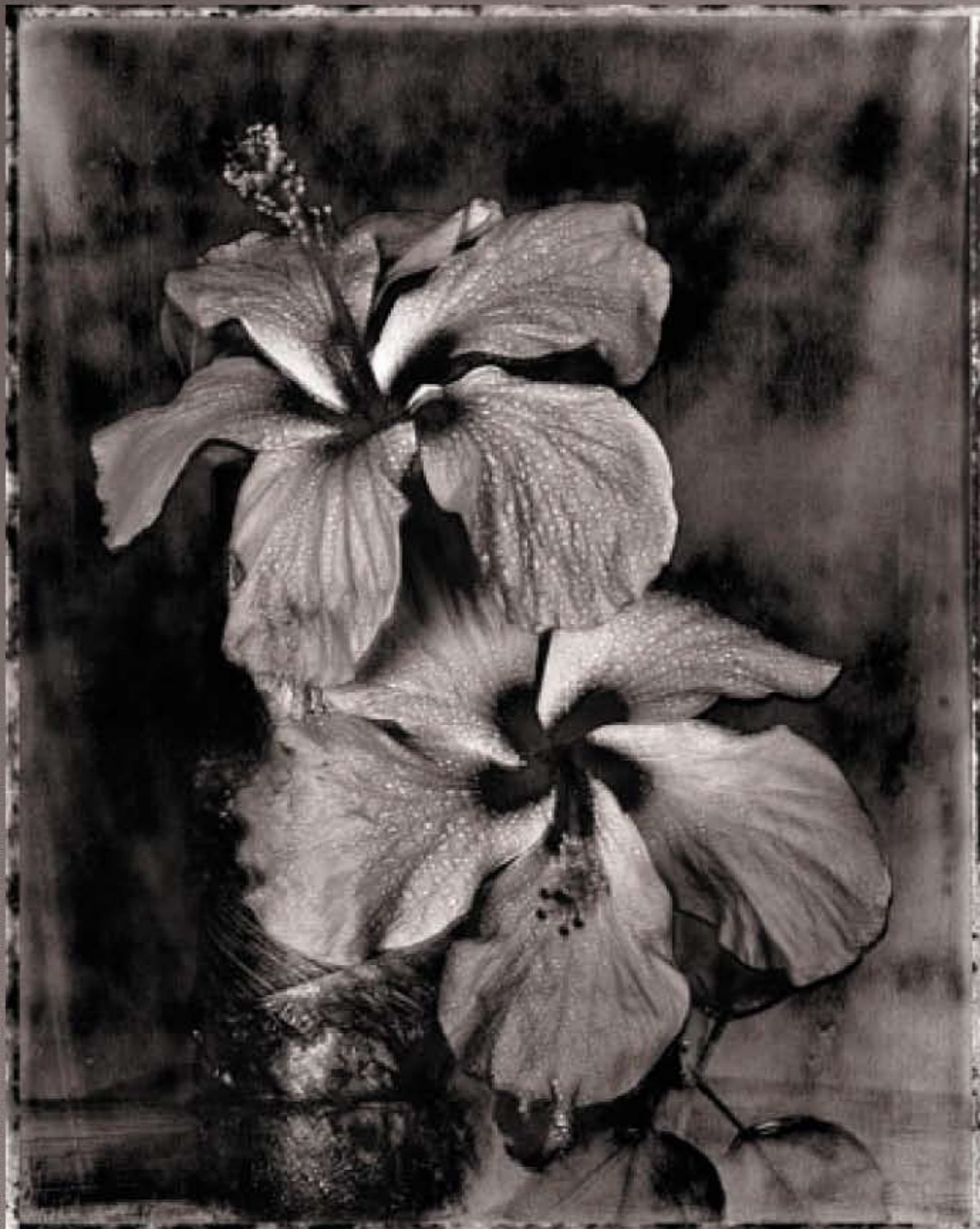
Questa foto è una stampa originale su carta fine art Epson e incollata a mano.