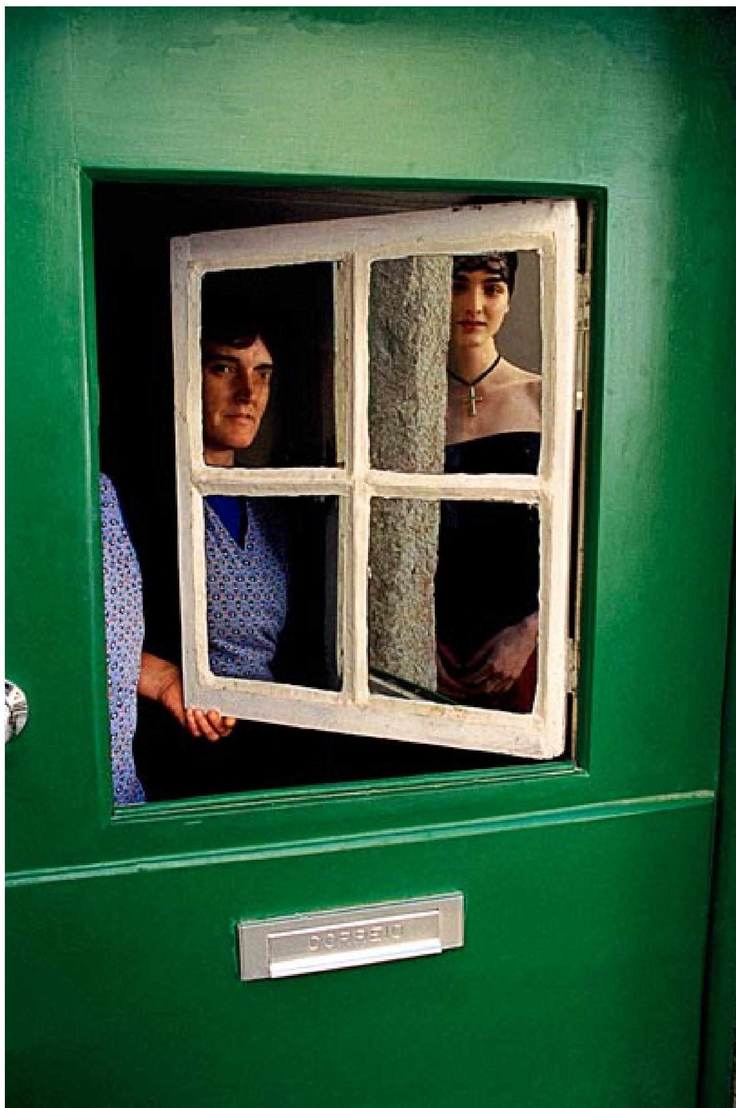
Allo specchio - Lisbona 1998

Questa foto è una stampa originale prodotta con Epson Stylus Pro e incollata a mano.