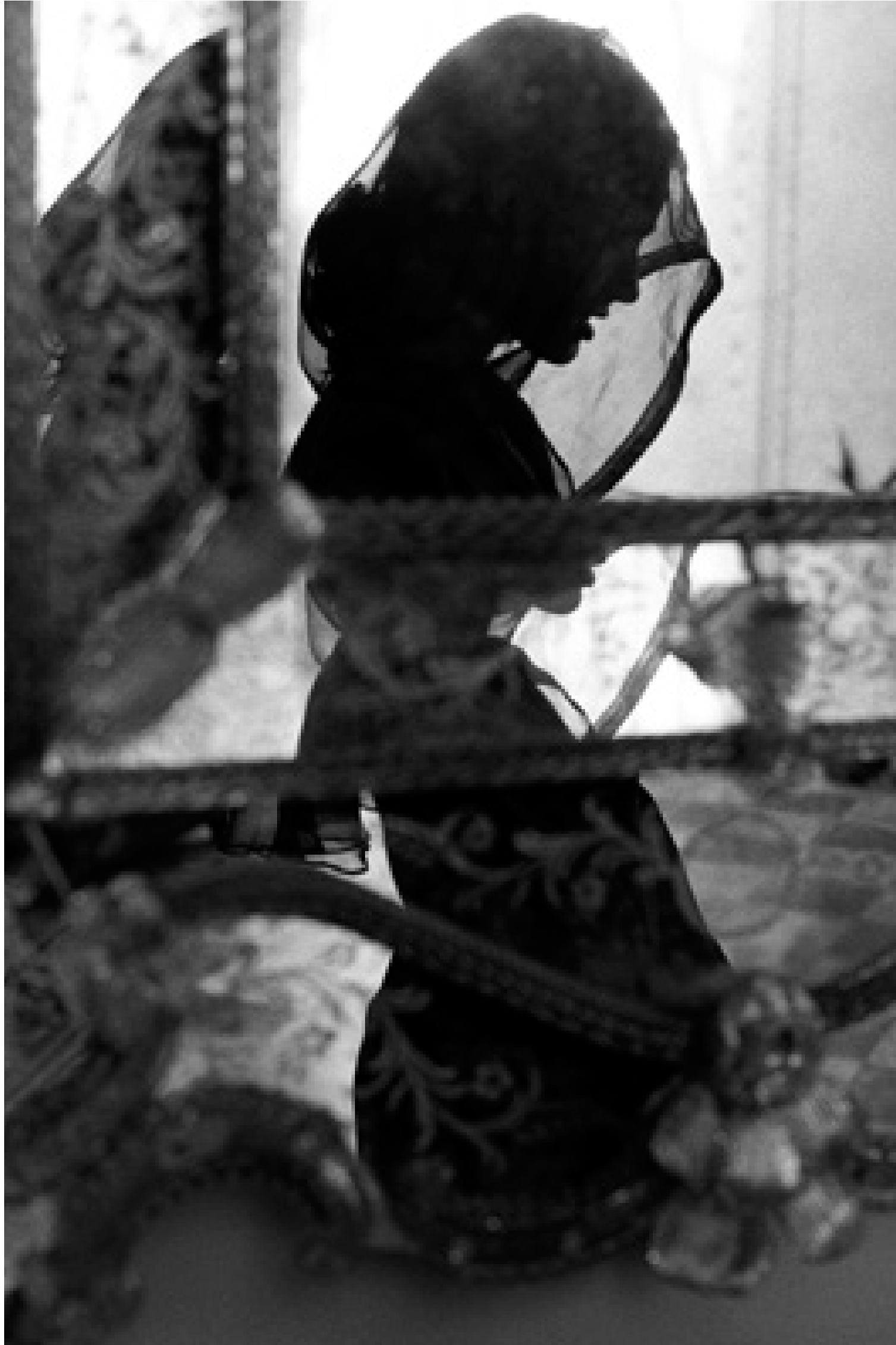
Allo specchio - Palermo 1991

Questa foto è una stampa originale prodotta con Epson Stylus Pro e incollata a mano.