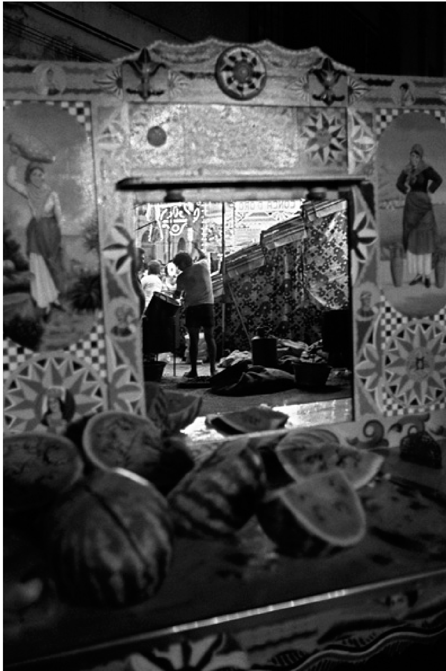
Allo specchio - Bagheria 1981

Questa foto è una stampa originale prodotta con Epson Stylus Pro e incollata a mano.