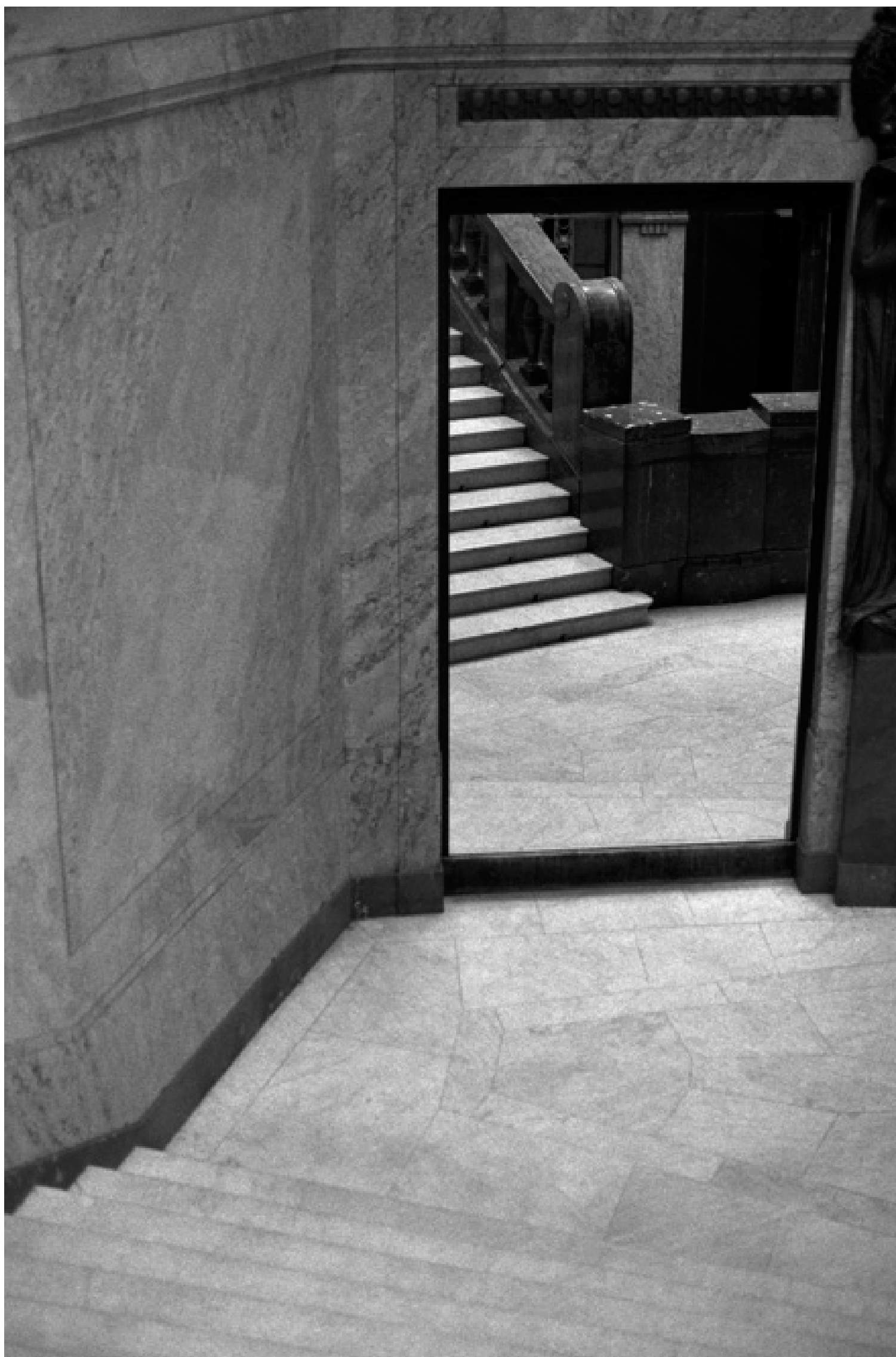
Allo specchio - Praga 1991

Questa foto è una stampa originale prodotta con Epson Stylus Pro e incollata a mano.