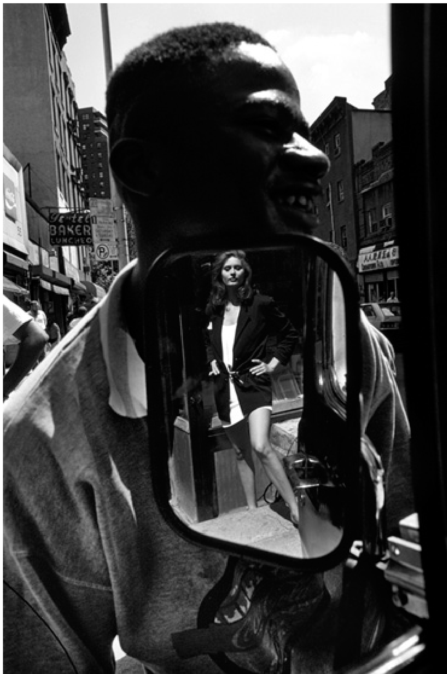
Allo specchio - New York 1991

Questa foto è una stampa originale prodotta con Epson Stylus Pro e incollata a mano.