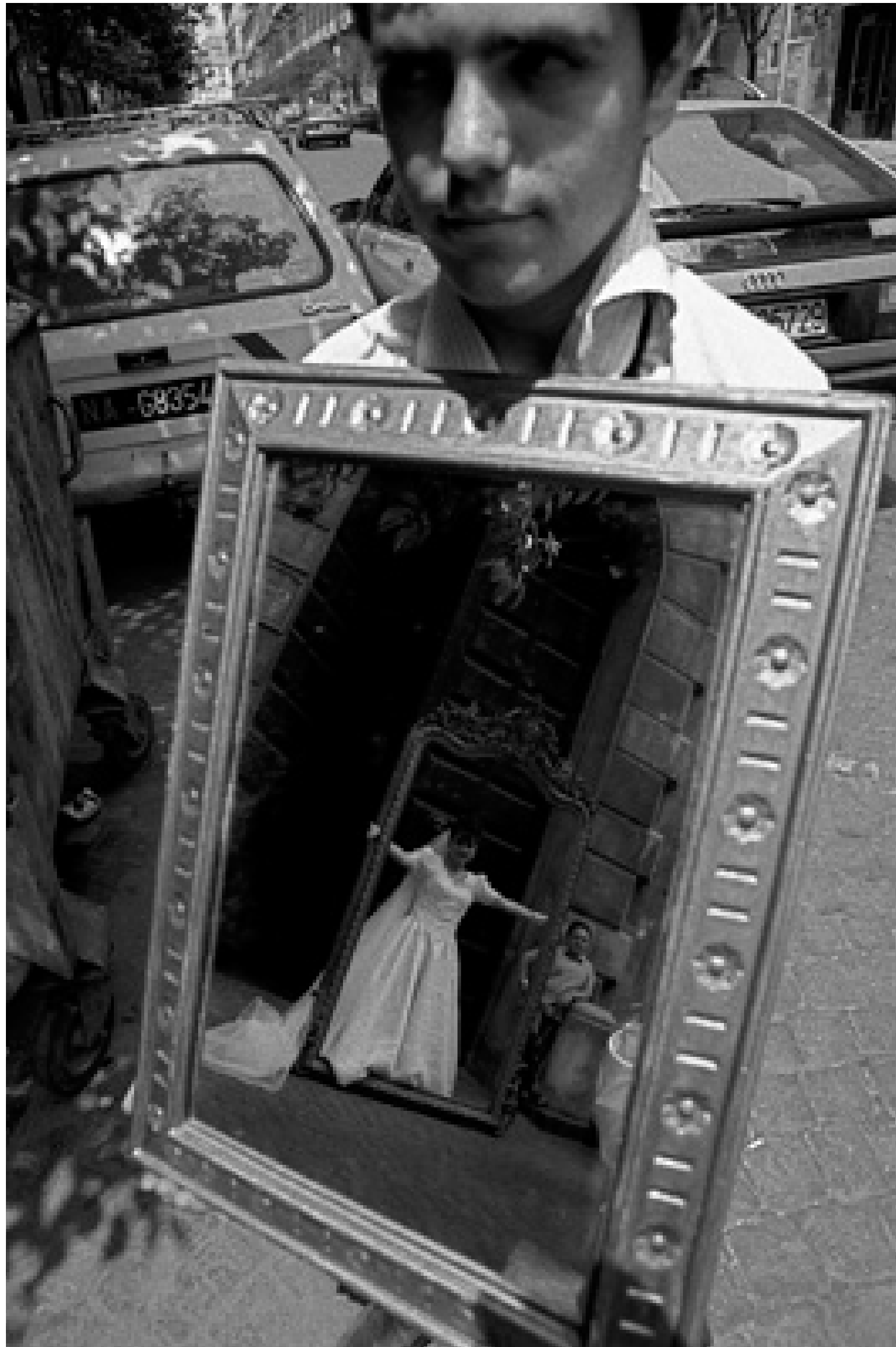
Allo specchio - Napoli 1992

Questa foto è una stampa originale prodotta con Epson Stylus Pro e incollata a mano.